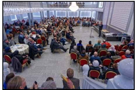
Bewonersavond APP.

Ondanks menig amendement en wellicht mede door het inspreken van de KBG, overleeft het plan de gemeenteraadsvergadering van 17 november 2016, zodat op 29 november een bewonersavond kan worden georganiseerd. Die verheugt zich dankzij een voor Zaanse begrippen ongekende reclamecampagne en de verstrekking van voedsel aan het begin van de bijeenkomst in een grote opkomst.