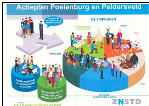
Actieplan Poelenburg en Peldersveld.

In het kader van de in het APP vermelde aanpak "Samen met de bewoners", wil de KBG in hetgeen volgt het hoofd bieden aan vragen en voorwaarden die onzes inziens essentieel zijn bij de bestrijding van de criminaliteit in de wijk, steeds voorafgegaan door een toelichting.