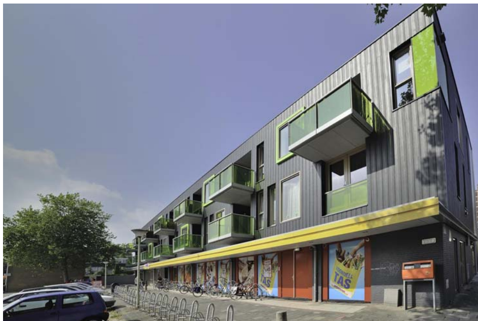
De Bloemkorf en de Vomar-supermarkt.