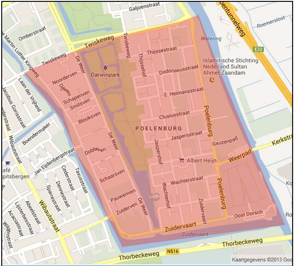
De Zaandamse wijk Poelenburg.